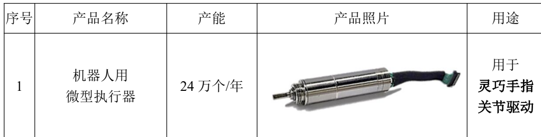
表 2-3 本项目产品方案一览表