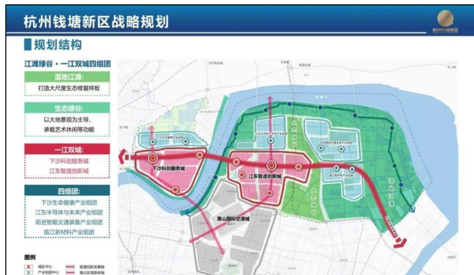
图 1-1 杭州钱塘新区战略规划图

产业空间布局：钱塘新区产业布局为“两城四区”共六个功能片区，分别为：东部湾新城片区、江海之城片区、医药港产业片区、钱塘芯谷产业片区、前进智造园产业片区、临江高科园产业片区。