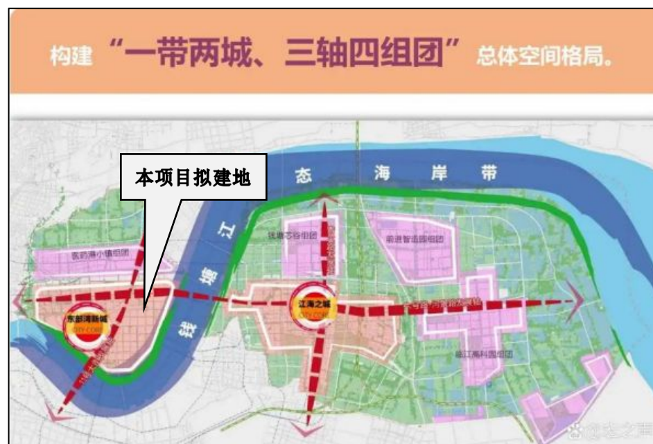
图 1-2 杭州钱塘新区“两城四区”布局图