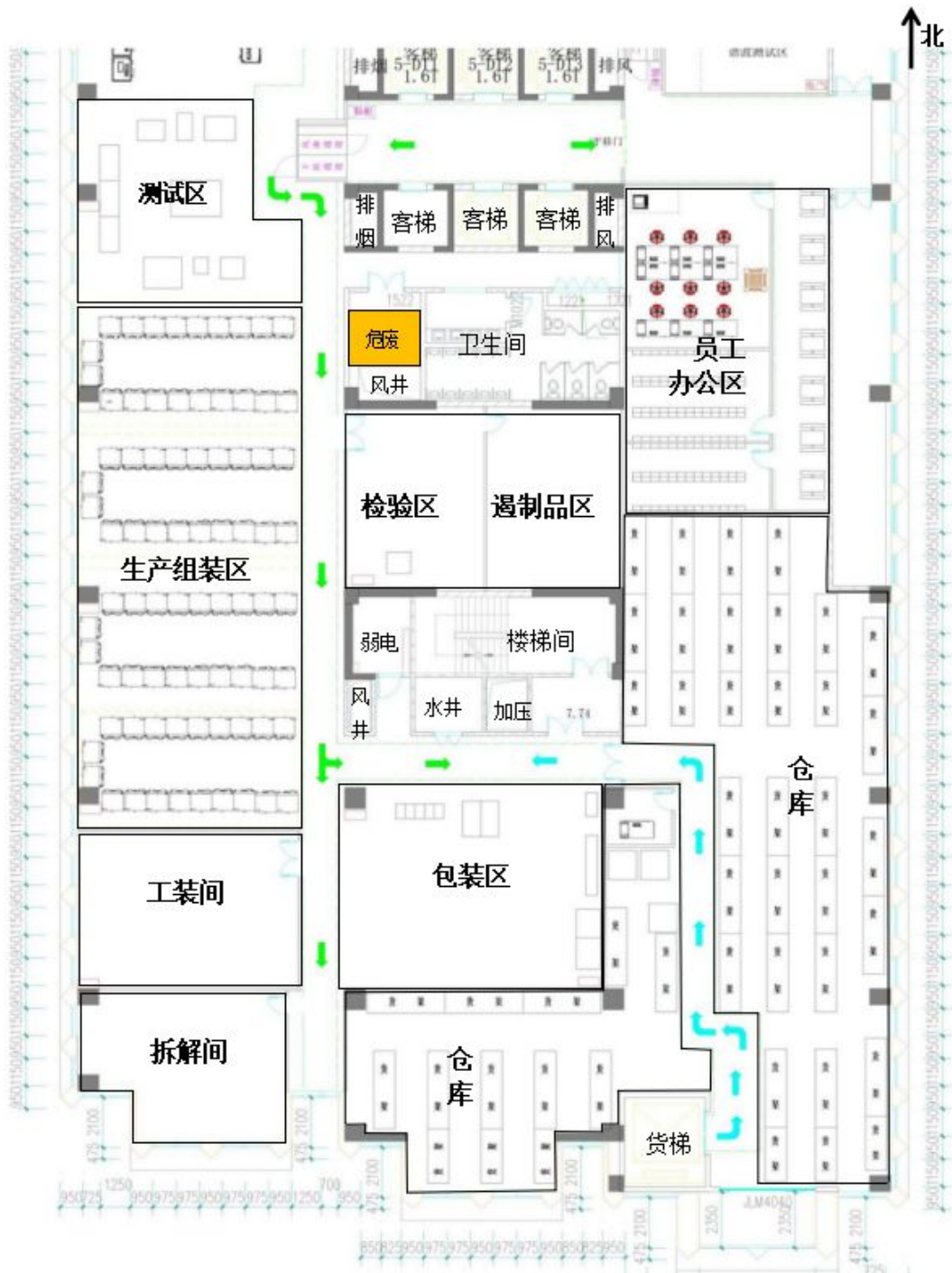
图 2-2 项目平面布置图

本项目厂房东侧从南至北依次为仓库、办公区；西侧从南至北依次为拆解间、工装间、生产区、测试区；包装区、检验室位于厂房中部。厂区内功能分区明确，布局合理。